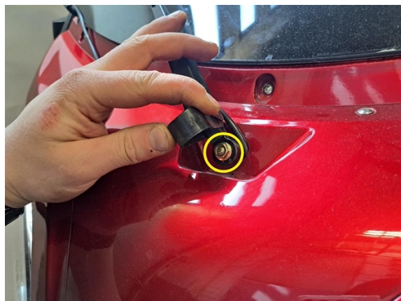
Irrota tuulilasinpyyhkijän kiinnitysmutteri. (hylsy 10 mm).