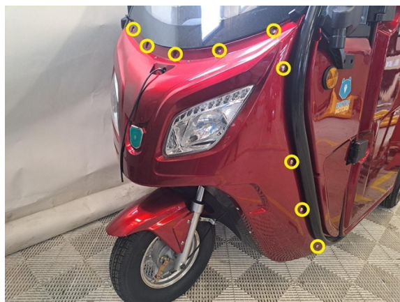
Irrota etukatteen kiinnitysruuvit kummaltakin sivulta ja tuulilasin edestä. (ristipäämeisseli ph2).